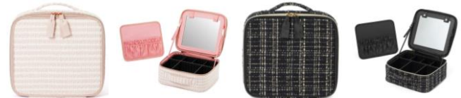
【商品名】ツイード バニティメイクバッグ 【種類】ピンク/ブラック 【価格】各 ¥5,200

小さなバッグにも入るサイズのミニバニティポーチです。リップや目薬を縦向きに収納できるので、中身を探しやすい出し入れしやすいのがポイントです。バニティを小さくしたコロんとしたデザインがかわいいファッション性が高いアイテムです。