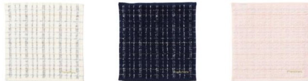
【商品名】抗菌防臭 ツweedパターン ハンカチタオル 【種類】ホワイト/ネイビー/ピンク 【価格】各 ¥800

ツイードのようなデザインがかわいい抗菌防臭機能を施したハンカチタオルです。無捻糸のバイエルとシャーリングの組み合わせで肌触りよくお使いいただけます。