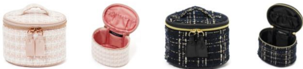
【商品名】ツイード バニティポーチ ミニ 【種類】ピンク/ブラック 【価格】各 ¥2,200

小さなバッグにも入るサイズのミニバニティポーチです。リップや目薬を縦向きに収納できるので、中身を探しやすい出し入れしやすいのがポイントです。バニティを小さくしたコロんとしたデザインがかわいいファッション性が高いアイテムです。