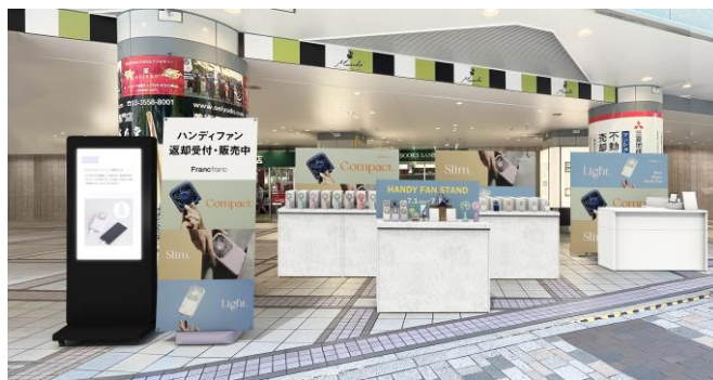
<東京交通会館 イメージ>