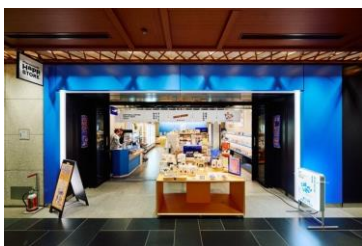
<Marunouchi Happ. STORE>

「Marunouchi Happ. Stand & Gallery」の系列店舗として「Marunouchi Happ. STORE」を2024年2月8日（木）にオープンし、「コーヒー（ドリップバッグ）・クラフトビール・本」を軸に、就業者の日常の拠りどころになるような商品や、エリアで開催されるイベントと連動したグッズ、オリジナルの丸の内土産等を企画販売する丸の内発のローカルデイリーストアです。思わず仕事の合間や仕事終わりに立ち寄りたくなるような要素を多数ちりばめ、ホッと一息ついていただけるようなスポットを目指しています。