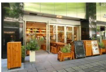
<Marunouchi Happ. Stand & Gallery>

「Marunouchi Happ. Stand & Gallery」は、ポップアップギャラリーとフードスタンドが融合した、丸の内仲通りにある小さなカフェスタンドです。そこは、雑誌のように次々とテーマが入れ替わる POP UP GALLERY。毎回、何が起きるか分からないドキドキを届けます。傍らには、仲通り“アーバンテラス”の拠点としてデイリーユースに立ち寄れる FOOD STAND。旬な野菜がたっぷり詰まった手作りサンドイッチ。熟練の醸造家が丹精込めて仕込むクラフトビール。原産地の個性を大切に自家焙煎したスペシャルティコーヒー。毎日、「ちゃんと美味しい」ものを変わず提供します。