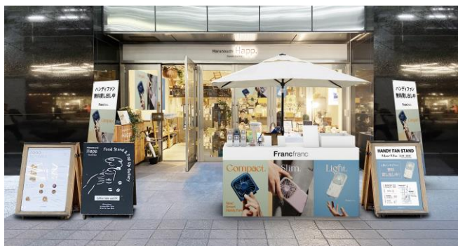
<Marunouchi Happ. Stand & Gallery イメージ>

ハンディファンを無料で借りて涼しさを持ち歩きながら丸の内・有楽町エリアの街歩きを楽しめる体験型イベントです。ブランドショップでのお買い物やカフェタイムの必携アイテムとして丸の内仲通りの新しい楽しみ方をご提案します。イベントでは、ハンディファンの累計販売台数が 350 万台を突破した Francfranc が作る、見た目も機能もさらにスマートになった次世代型ハンディファン「フレ スマートハンディファン」を翌日まで無料でご使用いただけます。イベントの拠点となる丸の内仲通りのカフェ『Marunouchi Happ. Stand & Gallery (マルノウチ ハップ スタンド&ギャラリー)』と有楽町の『東京交通会館』では、ハンディファンを購入することもできます。是非、この機会に持ち歩ける涼しさを体験してください。