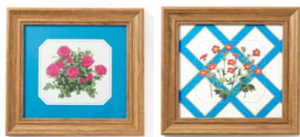
【商品名】ルル メリー アートボード 【種類】バラ レッド/ベニバナダイコンソウ 【価格】各 ¥3,000

ナチュラル調のフレームにルル メリーのアートとブルーのアクセントカラーが映えるアートボードです。ダイニングシーンはもちろん、リビングやベッドルームなど、お部屋のアクセントになるアイテムです。八角形と四角形をラインアップし、コーディネートが楽しめます。