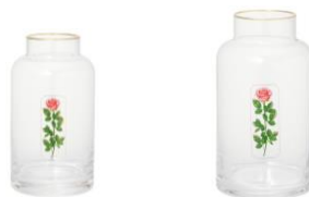
【商品名】ルル メリー バラ ピンク フラワーベース S 【価格】 ¥ 2,500 【商品名】ルル メリー バラ ピンク フラワーベース M 【価格】 ¥ 3,500

曲線が美しいクリアベースにルル メリーのバラとゴールドリムのデザインがモダンさを感じるフラワーベースです。お花を飾ってテーブルコーディネートがすれば、より豊かで幸せなティータイムを楽しめます。