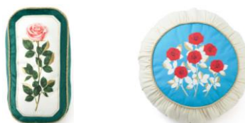
【商品名】ルル メリー クッション 【種類】バラ ピンク/バラ 【価格】各 ¥4,200

左：ショコラサブレのパッケージデザインを落とし込んだクッションカバーです。鮮やかなブルーとバラのコントラストがモダンな印象を引き立てます。周囲に施したロープパイピングが繊細で上品なアイテムです。