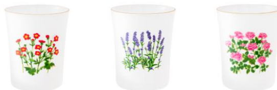
【商品名】ルル メリー フロストタンブラー 【種類】ベニバナダイコンソウ/ラベンダー/バラ 【価格】各 ¥ 1,400

レモンサブレのパッケージデザインを落とし込んだフロストタンブラーです。曇りガラスとゴールドリムが上品で高級感のあるティータイムを演出します。セラミックシリーズと一緒にコーディネートを楽しめます。