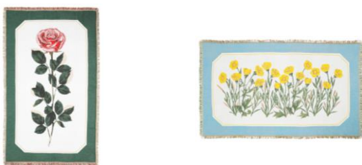
【商品名】ルル メリー スロー 【種類】バラ ピンク/ミヤマキンポウゲ 【価格】各¥8,800

モダンでキャッチーなルル メリーのパッケージデザインをクラシカルなジャガード織りで仕上げたインパクトのあるスローです。1枚でブランドの世界観を表現しています。ソファやベッドとコーディネートするのはもちろん、タペストリーとしてアートのように壁に飾っても楽しめます。