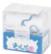
【商品名】ルル メリー お花のティグレ&ハンカチセット 【価格】¥2,200 【内容】ハンカチタオル×1、お花のティグレ ショコラ×1、お花のティグレ ローズ×1

国産バターとチョコチップを入れた生地の中にチョコレートを入れたルル メリーの新品の焼き菓子「お花のティグレ」2種類と「お花のティグレ」のモダンな世界観をデザインに落とし込んだハンカチタオルのセットです。ハンカチタオルはモダンなバラの刺繍と波のデザインが魅力的なアイテムでギフトとしてもおすすめです。