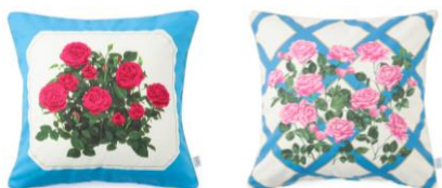
【商品名】ルル メリー クッションカバー 【種類】バラ レッド/バラ 【価格】各 ¥3,500