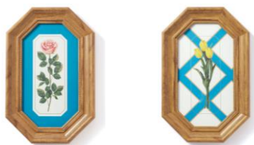
【商品名】ルル メリー アートボード 【種類】バラ ピンク/チューリップ 【価格】各 ¥3,000