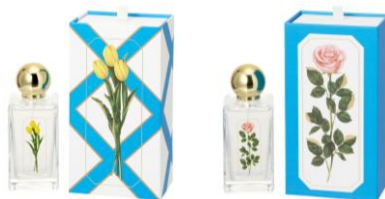
【商品名】ルル メリー ルームフレグランススプレー 【種類】チューリップ/バラ ピンク 【価格】各¥3,600

ルル メリーのレモンサブレとショコラサブレのパッケージデザインをイメージしたルームフレグランススプレーです。エッセンシャルオイルを使用し、ナチュラルなチューリップとローズの本格的な香りを楽しめます。クラシカルな形のガラス瓶やゴールドのキャップが印象的な、上質で存在感のあるアイテムです。